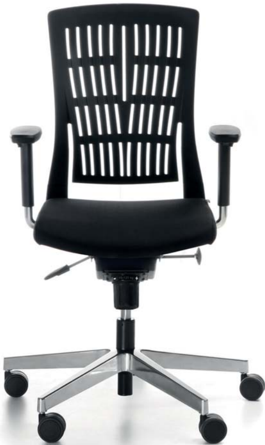
MB 102 VMS