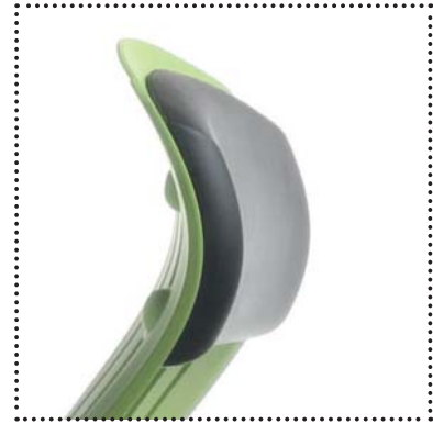
Weiche Polyurethan-Kopfstütze Miękki, poliuretanowy zagłówek